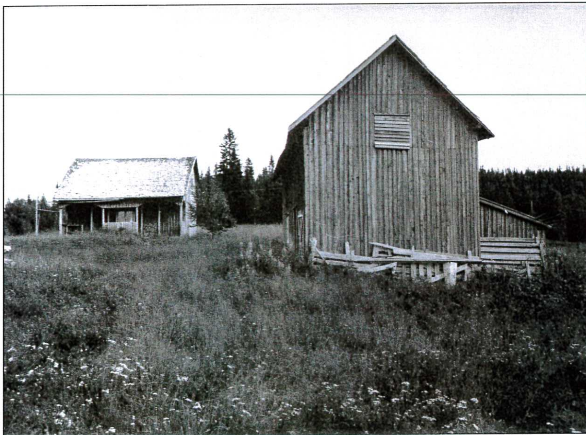
Limannvika. Uthuset (t.h.) er flyttet til Norsk Vegmuseum.