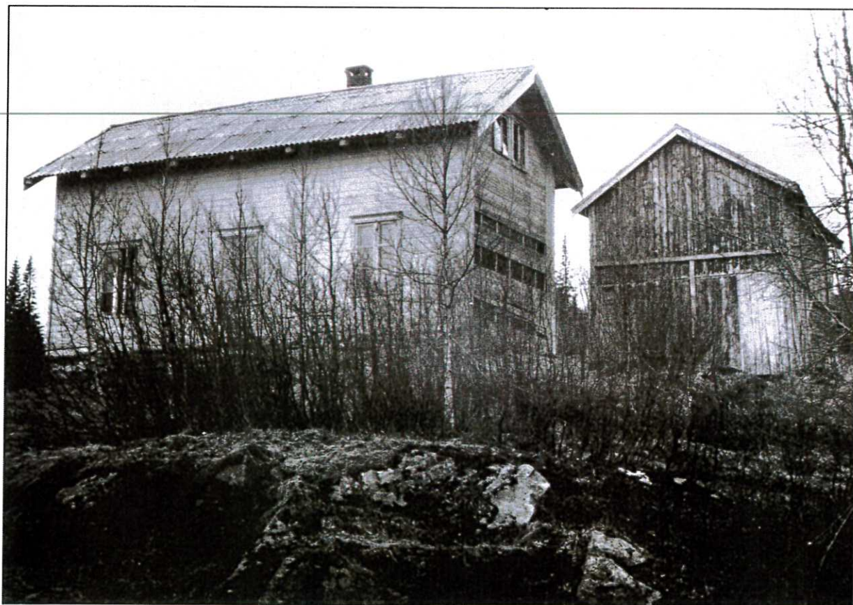
Juni 1977. Gosen vegvokterbolig står for fall.